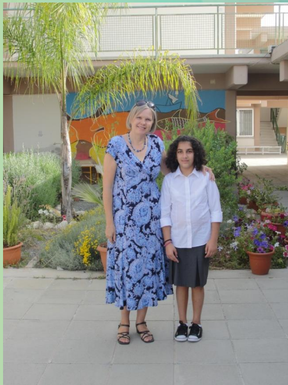
Ομάδα Γ' (Γ' Δημοτικού)