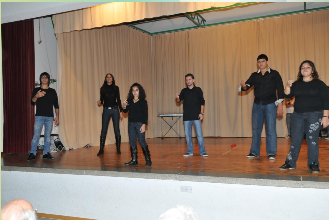
Τραγούδι στη Νοηματική και χορός