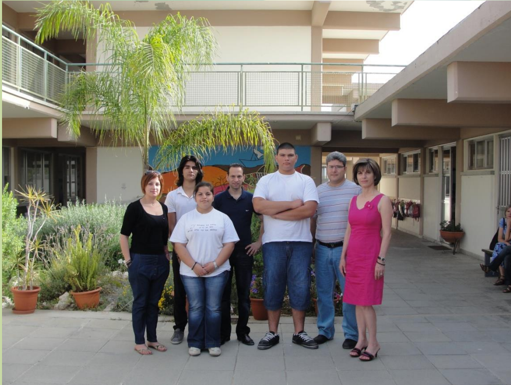
Ομάδα Μ2 (Β΄ Γυμνασίου)