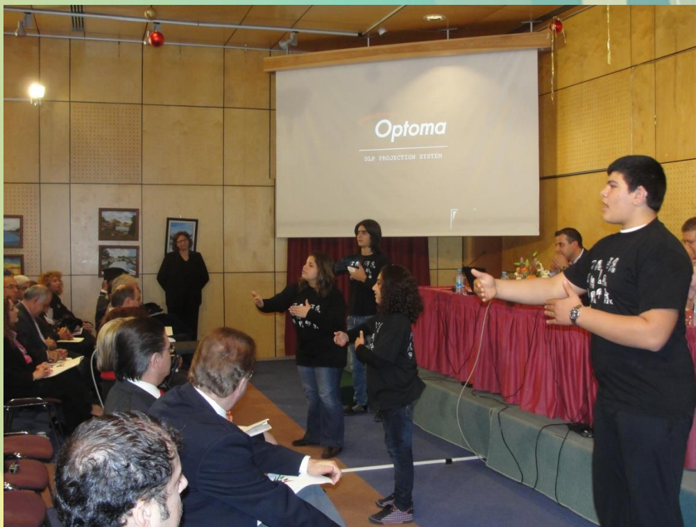
Από την εκδήλωση στη Δημοσιογραφική Εστία