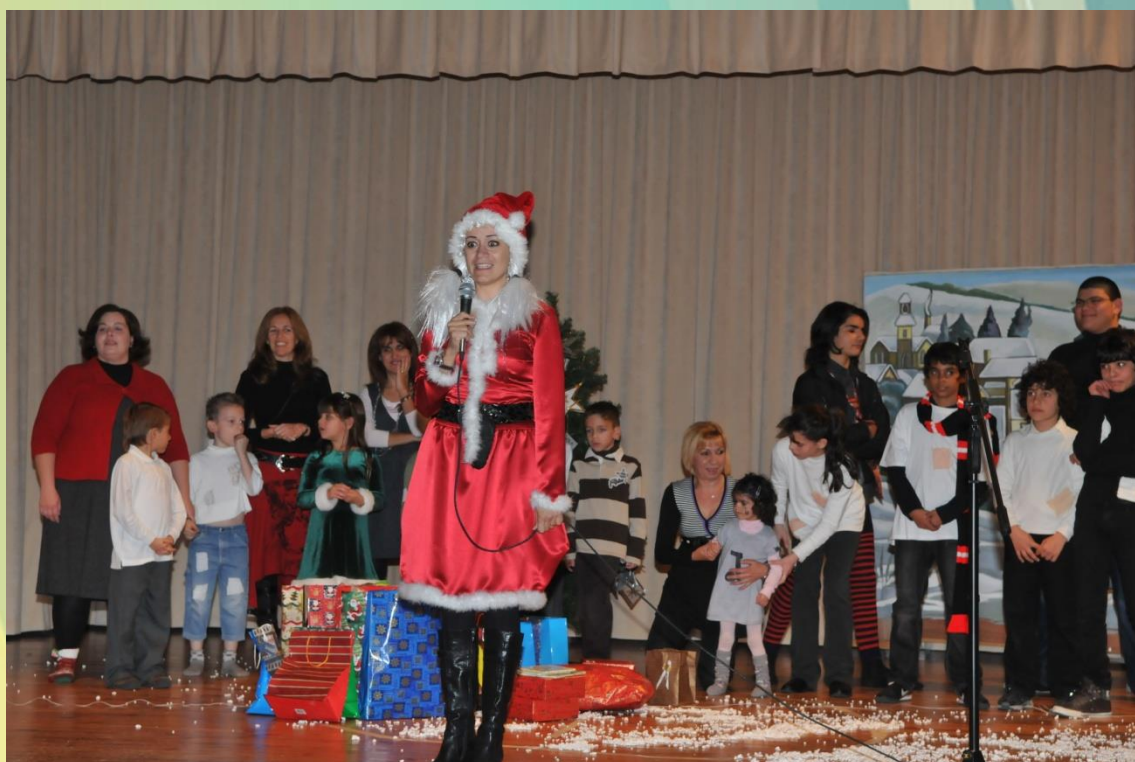
Από τη Χριστουγεννιάτικη γιορτή στη Σχολή Κωφών